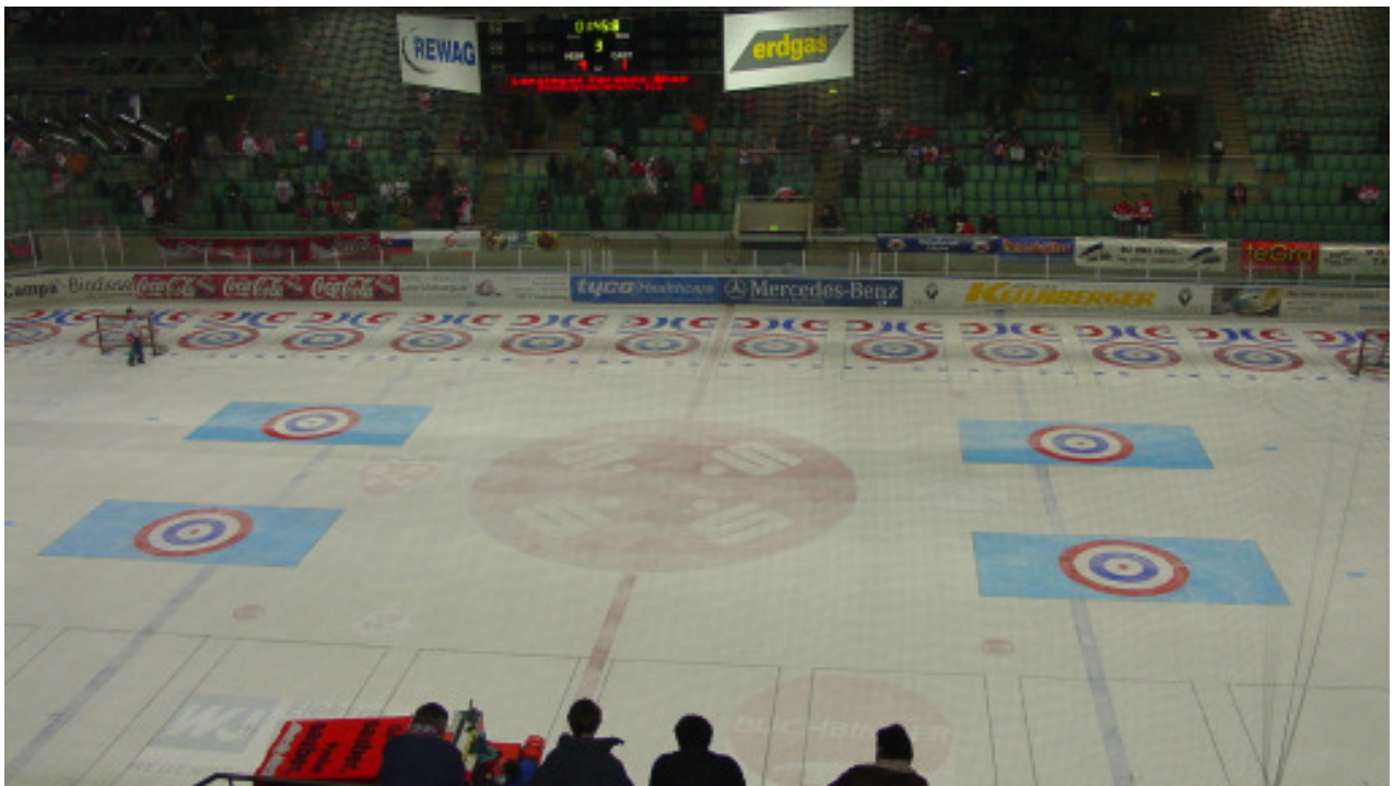
- farbige Zielfelder bei der EM in Regensburg -